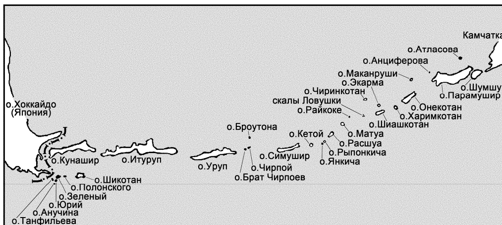
Карта-схема Курильских островов.